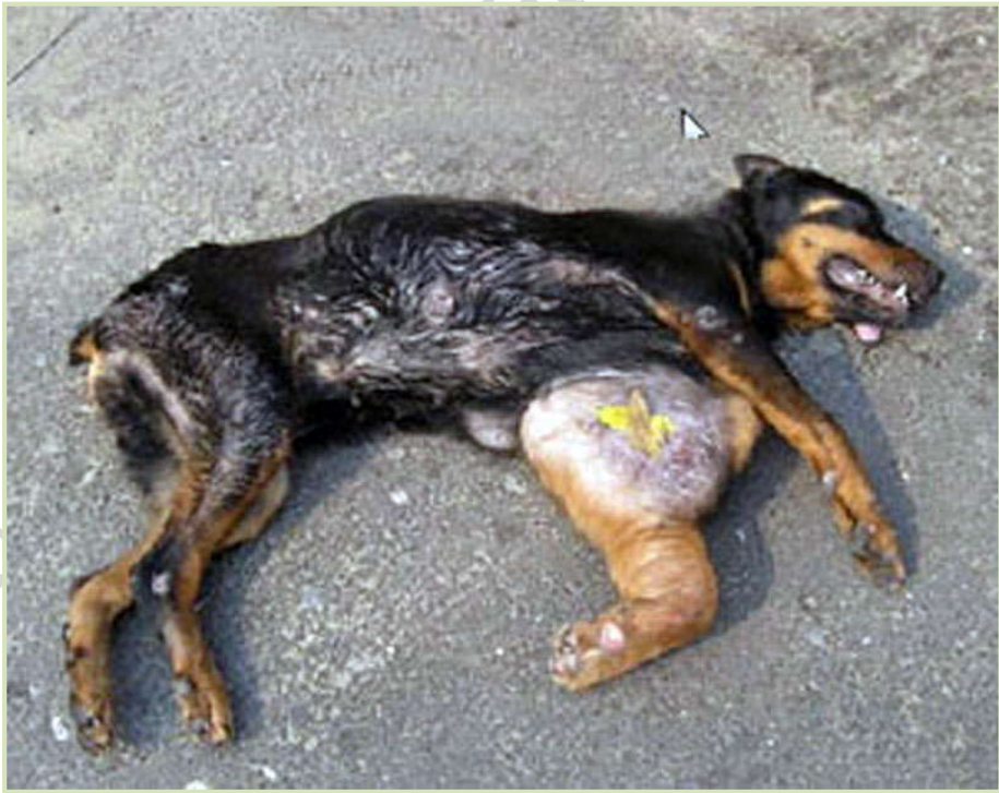
Εγκατάλειψη στον δρόμο...