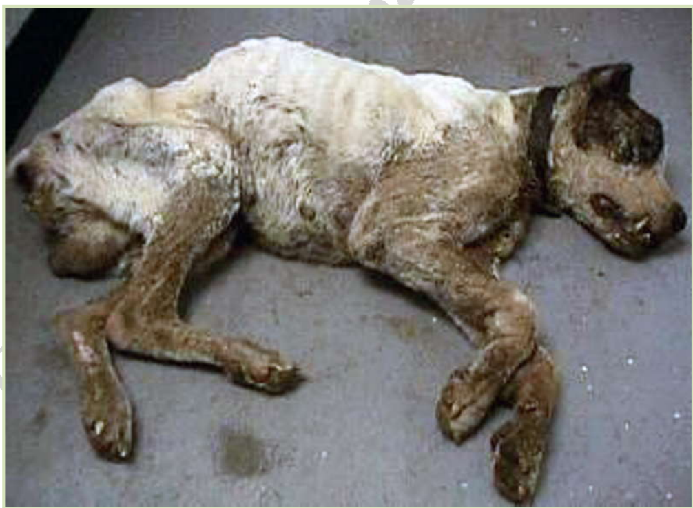
Πεθαμένο στον δρόμο..